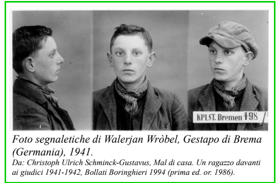
Foto segnaletiche di Walerjan Wròbel, Gestapo di Brema (Germania), 1941.

Ricordo bene che quando un'alunna consegnò due fogli che recavano lo stesso titolo, le dissi: "Ma hai sbagliato!", e lei rispose prontamente: "Prof, li legga!".