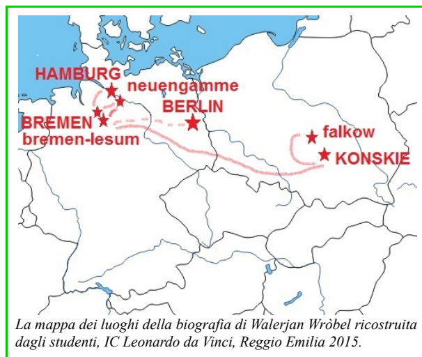
La mappa dei luoghi della biografia di Walerjan Wròbel ricostruita dagli studenti, IC Leonardo da Vinci, Reggio Emilia 2015.